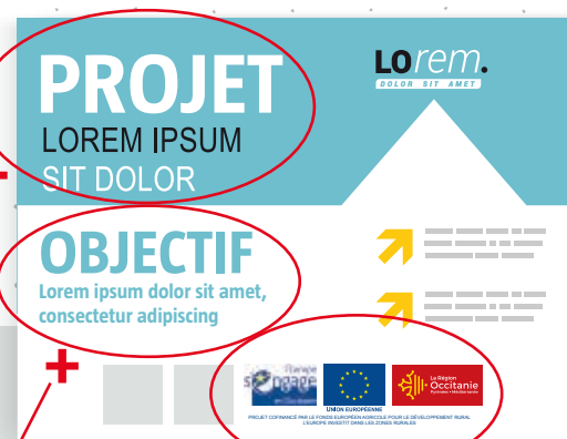
Panneau de dimensions importantes