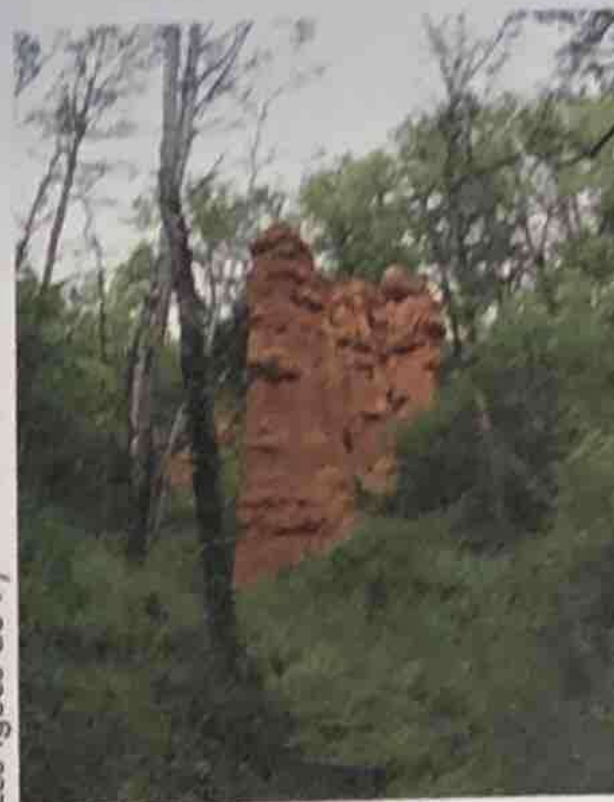
Les Igues du Py

Patrie d'Henri Mouly, écrivain occitan grand maître du félibrige, le village est très pittoresque avec son église du XIII e originale par son clocher entouré de quatre clochetons. Le pont en dos d'âne du Cambon fut édifié à l'ancienne dans les années 1800 pour amener la chaux depuis Villeneuve afin de fertiliser le Ségala. Enfin, résultant d'un curieux phénomène d'érosion, les Igues du Py et de Rouffiès composées de cheminées de fées sont uniques dans la région. Ce curieux phénomène a été provoqué par le ruissellement des eaux et les gelées qui ont provoqué des ravinements bordés d'à-pic impressionnants, de chaque côté du ravin sur les pentes abruptes. La terre passe du rouge sombre à l'ocre clin.